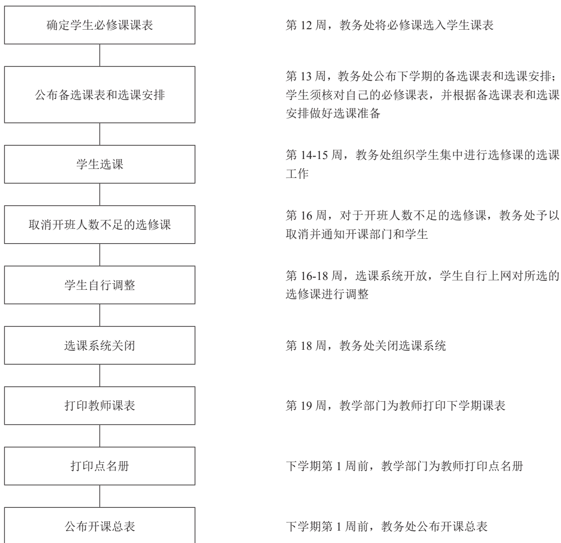
图 2 选课操作流程

新生第一学期选课安排在正式上课前一周内进行，其他年级学生的选课工作均于开课前一学期集中进行，主要选课操作流程如图 2 所示。